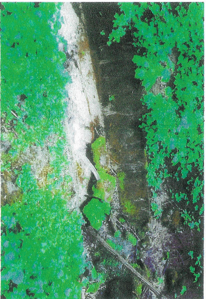
odvod vody cez ťaŕ. pŕiekopu